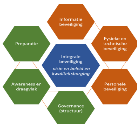
Figuur 1: thema's integrale beveiliging

Het doel van het project Integrale Beveiliging Gemeenten van het ministerie van BZK is om gemeenten te ondersteunen in hun ambitie om weerbaar te zijn tegen moedwillige risico's die schade kunnen veroorzaken aan de gemeentelijke organisatie. Op de website (XXX) zijn alle bouwstenen opgenomen voor de inhoudelijke uitwerking en organisatorische inbedding van integrale beveiliging. Dit document is de uitwerking van 1 van de bouwstenen, namelijk de organisatorische integraliteit: de governance en het kwaliteitssysteem.